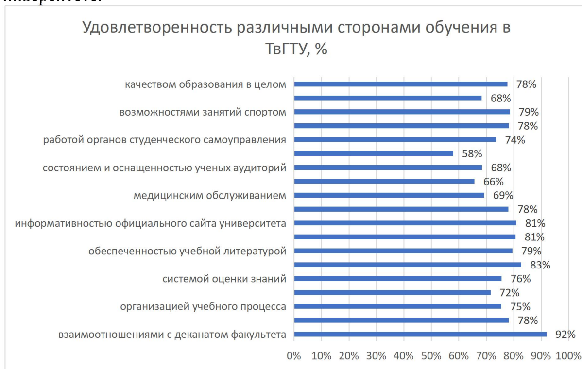
Рисунок 1 – Средние проценты удовлетворенности обучающихся по образовательной программе 09.03.02 Информационные системы и технологии, направленность (профиль) Разработка, внедрение и сопровождение информационных систем различными сторонами обучения в ТвГТУ

На рисунке 1 представлены средние оценки удовлетворенности обучающихся по образовательной программе 09.03.02 Информационные системы и технологии, направленность (профиль) Разработка, внедрение и сопровождение информационных систем по различным сторонам обучения в университете.