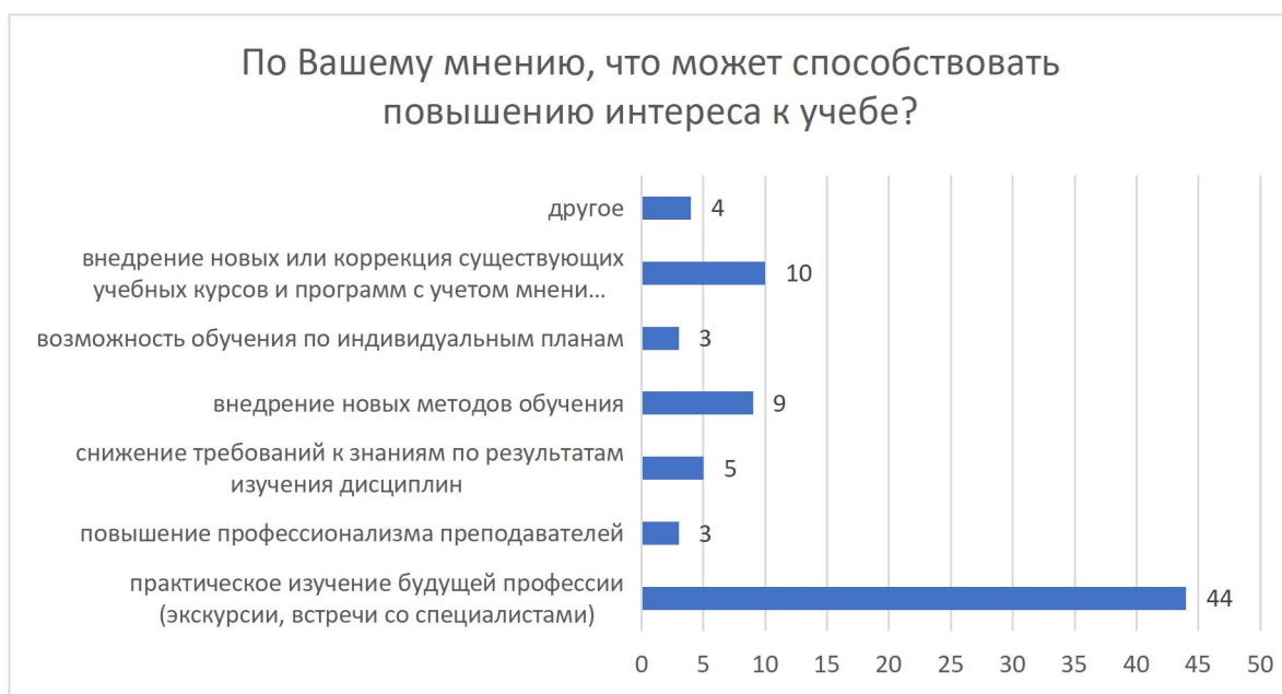
Рисунок 7 – Распределение ответов на вопрос «По Вашему мнению, что может способствовать повышению интереса к учебе?»

Возможность подключения к электронно-библиотечной системе вуза из любой точки, где есть сеть Интернет есть у 75% опрошенных (62 чел.), у 23% (15 чел.) это получается не всегда, у 3% (1 чел.) такой возможности нет вовсе.