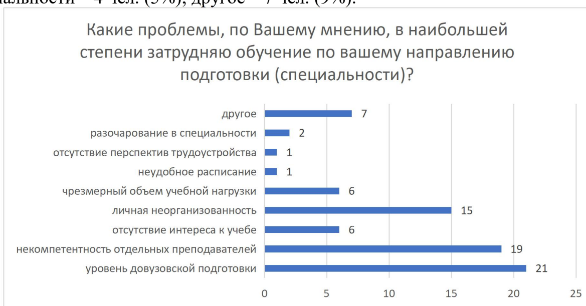
Рисунок 6 – Распределение ответов на вопрос «Какие проблемы, по Вашему мнению, в наибольшей степени затрудняют обучение по вашему направлению подготовки (специальности)?»

Среди проблем, которые в наибольшей степени затрудняют обучение по направлению подготовки (специальности), обучающиеся отметили: уровень довузовской подготовки – 21 чел. (27%); некомпетентность отдельных преподавателей – 19 чел. (24%); отсутствие интереса к учебе – 6 чел. (8%); личная неорганизованность – 15 чел. (19%); чрезмерный объем учебной нагрузки – 6 чел. (8%); неудобное расписание – 1 чел. (2%); отсутствие перспектив трудоустройства – 1 чел. (2%); разочарование в специальности – 4 чел. (5%); другое – 7 чел. (9%).