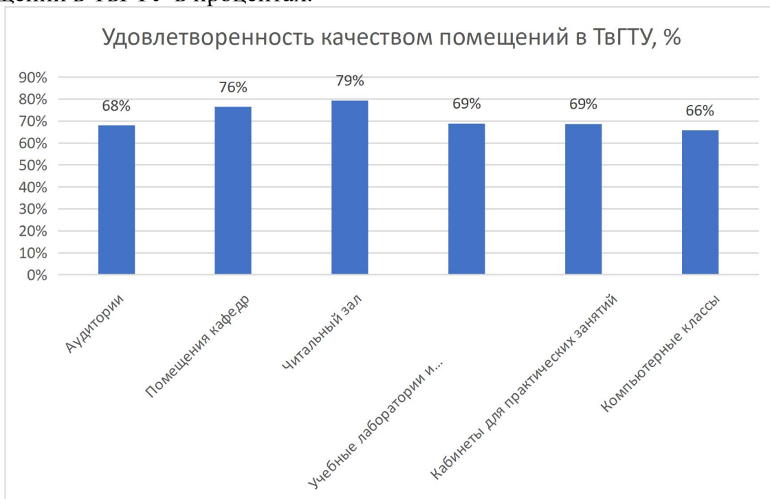
Рисунок 2 - Удовлетворенность обучающихся по образовательной программе 09.03.02 Информационные системы и технологии,

На рисунке 2 представлены данные по удовлетворенности обучающихся по образовательной программе 09.03.02 Информационные системы и технологии, направленность (профиль) Разработка, внедрение и сопровождение информационных систем качеством помещений в ТвГТУ в процентах.