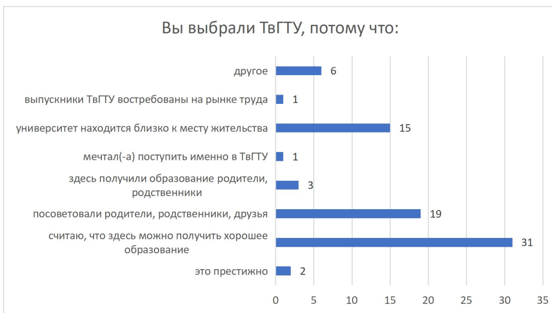
Рисунок 4 – Распределение ответов респондентов на вопрос «Вы выбрали ТвГТУ, потому что?»

Респонденты на вопрос «Что привлекло вас в выбранной вами специальности/направлении» дали такие ответы (рисунок 5): нравится будущая профессия – 28 чел. (36%); выбрал случайно – 5 чел. (6%); специальность одна из самых престижных – 10 чел. (13%); специальность одна из самых высокооплачиваемых – 9 чел. (12%); обучался по этой специальности ранее (в ссузе, колледже и т.п.) – 4 чел. (5%); считаю ее перспективной для карьерного роста – 19 чел. (24%); настояли родители – 1 чел. (1%); другое – 2 чел. (3%).