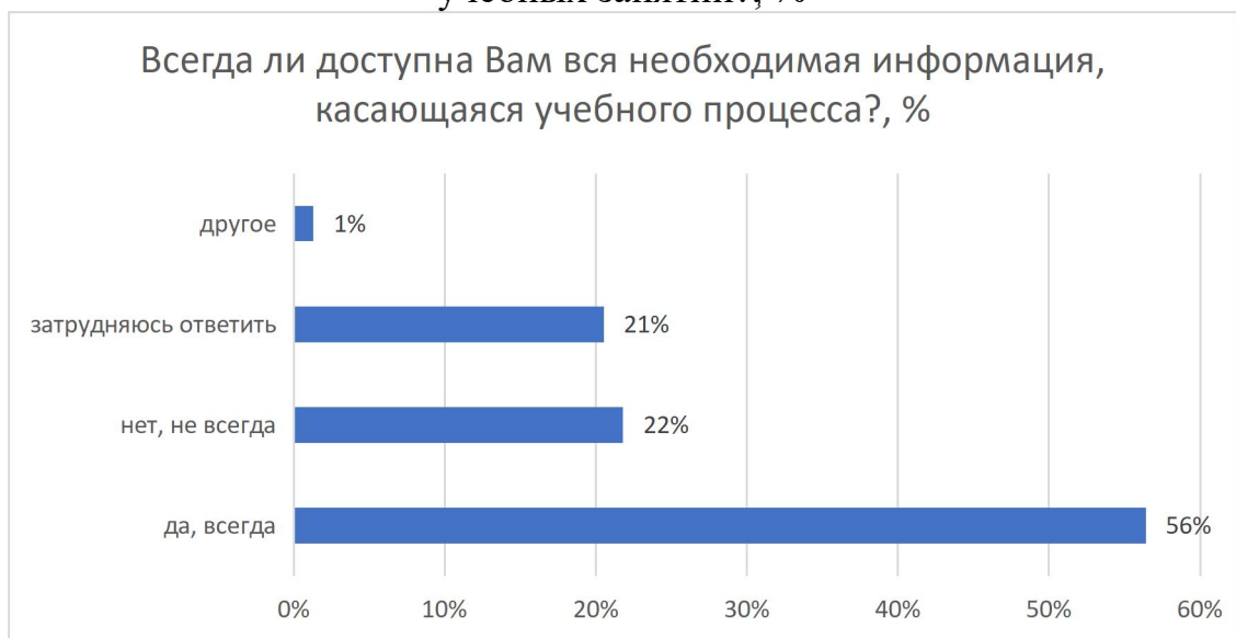
Рисунок 11 – Всегда ли доступна Вам вся необходимая информация, касающаяся учебного процесса?, %