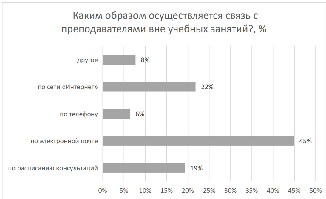
Рисунок 10 – Каким образом осуществляется связь с преподавателями вне учебных занятий?, %