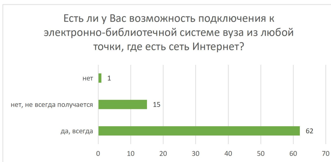
Рисунок 8 – Распределение ответов на вопрос «Есть ли у Вас возможность подключения к электронно-библиотечной системе вуза из любой точки, где есть сеть Интернет?»

Возможность подключения к электронно-библиотечной системе вуза из любой точки, где есть сеть Интернет есть у 75% опрошенных (62 чел.), у 23% (15 чел.) это получается не всегда, у 3% (1 чел.) такой возможности нет вовсе.