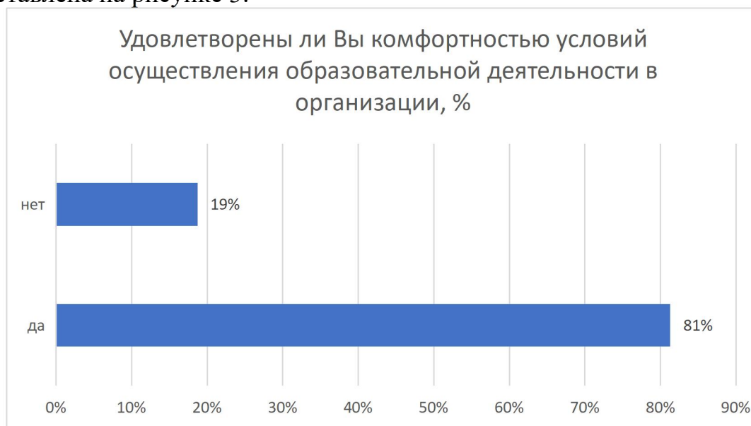
Рисунок 3 - Удовлетворенность комфортностью условий осуществления образовательной деятельности в университете

В целом удовлетворенность комфортностью условий осуществления образовательной деятельности в университете (обеспечение в организации комфортных условий, в которых осуществляется образовательная деятельность: наличие зоны отдыха (ожидания); наличие и понятность навигации внутри организации; наличие и доступность питьевой воды; наличие и доступность санитарно-гигиенических помещений; удовлетворительное санитарное состояние помещений организации) представлена на рисунке 3.