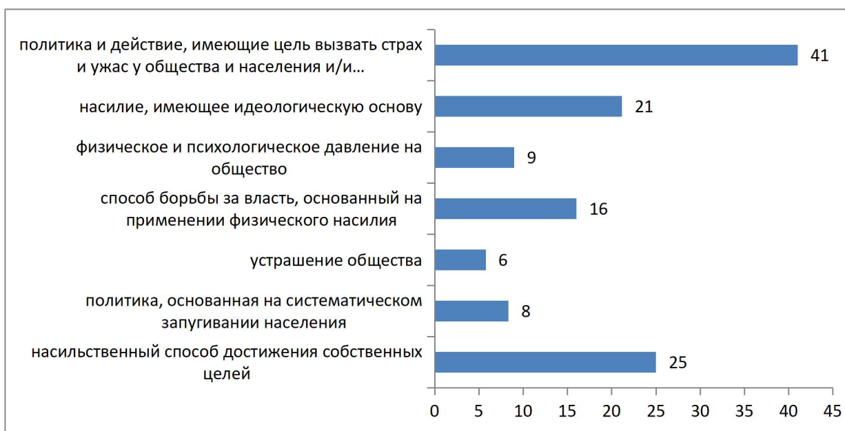
Рисунок 1 – Выберите наиболее близкую для Вас формулировку «терроризм – это»? %

50% опрошенных считают, что в современном обществе существует проблема терроризма, 43% – скорее да, 6% – скорее нет, 1% – нет.