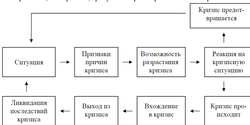
Рис. 1. Стратегия антикризисного управления

В условиях кризиса необходимо специфическое антикризисное управление, характеризующееся определенными подходами и приемами. Сущность антикризисного управления составляют радикальные перемены в деятельности фирмы. Управление кризисом, как правило, требует быстрых и решительных перемен.