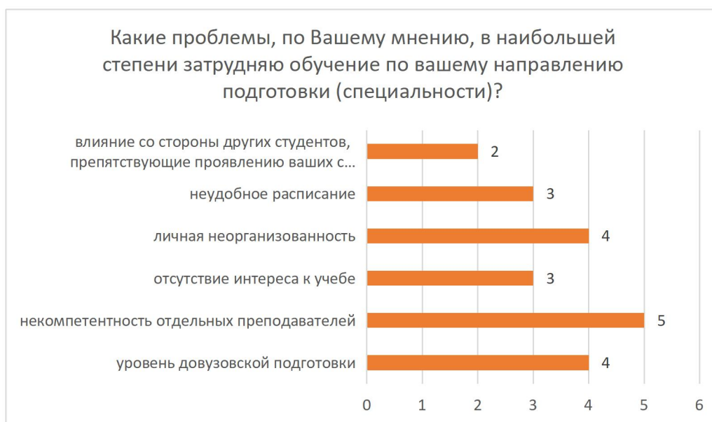
Рисунок 6 – Распределение ответов на вопрос «Какие проблемы, по Вашему мнению, в наибольшей степени затрудняют обучение по вашему направлению подготовки (специальности)?»

Среди факторов, которые могут способствовать повышению интереса к учебе, респонденты отметили: