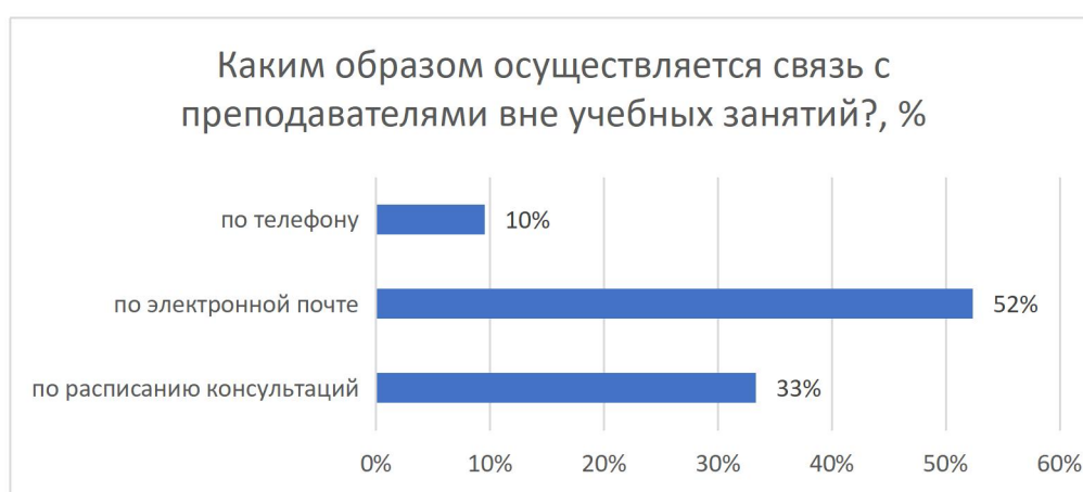
Рисунок 10 – Каким образом осуществляется связь с преподавателями вне учебных занятий?, %