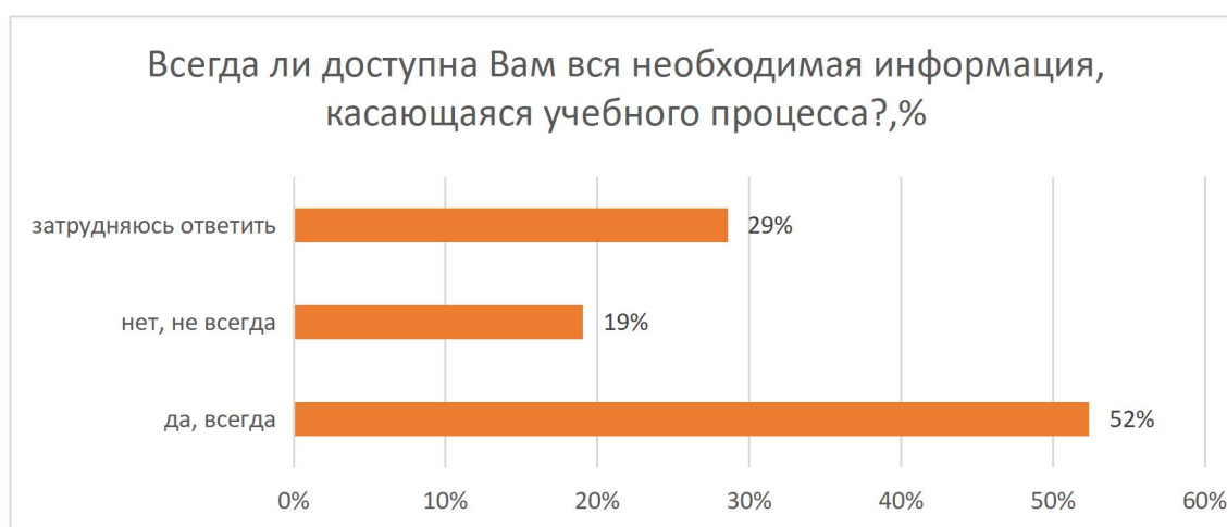
Рисунок 11 – Всегда ли доступна Вам вся необходимая информация, касающаяся учебного процесса?, %