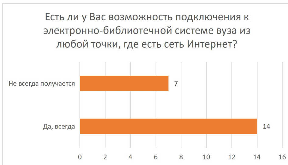
Рисунок 8 – Распределение ответов на вопрос «Есть ли у Вас возможность подключения к электронно-библиотечной системе вуза из любой точки, где есть сеть Интернет?»

Возможность подключения к электронно-библиотечной системе вуза из любой точки, где есть сеть Интернет есть у 67% опрошенных (14 чел.), у 33% (7 чел.) это получается не всегда.