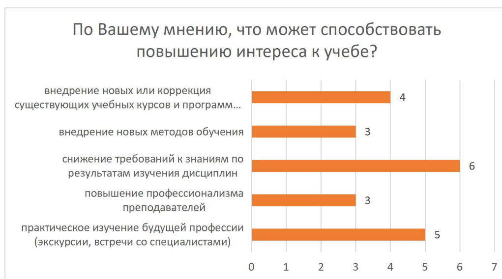
Рисунок 7 – Распределение ответов на вопрос «По Вашему мнению, что может способствовать повышению интереса к учебе?»

внедрение новых или коррекция существующих учебных курсов и программ с учетом мнений студентов – 4 чел. (19%).