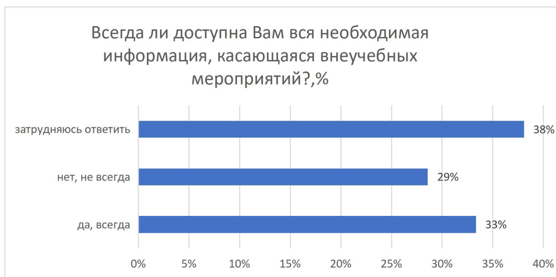
Рисунок 12 – Всегда ли доступна Вам вся необходимая информация, касающаяся внеучебных мероприятий?, %

38% (8 чел.) респондентов отметили, что хотели бы вы участвовать в деятельности по управлению качеством образования в ТвГТУ.