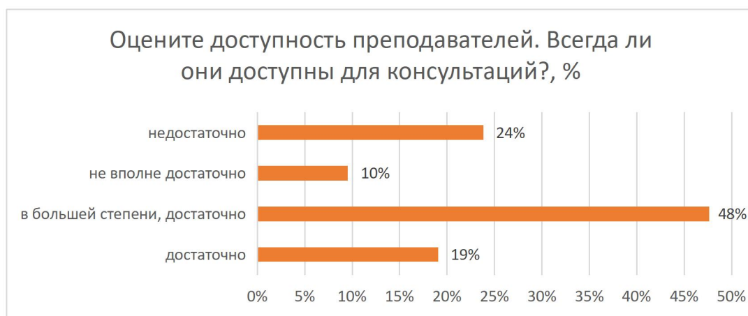
Рисунок 9 – Оцените доступность преподавателей. Всегда ли они доступны для консультаций?, %