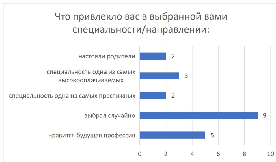
Рисунок 5 – Распределение ответов на вопрос «Что привлекло вас в выбранной вами специальности/направлении»

У 10 чел. (48%) опрошенных полностью оправдались ожидания в части качества образования в ТвГТУ, у 4 чел. (19%) оправдались частично и у 7 чел. (33%) не оправдались вообще.