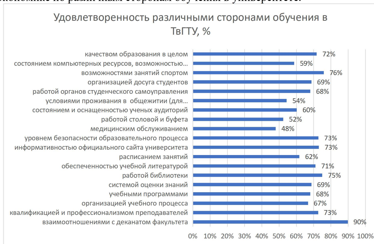
Рисунок 1 – Средние проценты удовлетворенности обучающихся по образовательной программе 09.03.03 Прикладная информатика, направленность (профиль) Прикладная информатика в экономике различными сторонами обучения в ТвГТУ

На рисунке 1 представлены средние оценки удовлетворенности обучающихся по образовательной программе 09.03.03 Прикладная информатика, направленность (профиль) Прикладная информатика в экономике по различным сторонам обучения в университете.