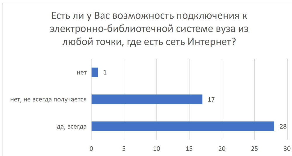
Рисунок 8 – Распределение ответов на вопрос «Есть ли у Вас возможность подключения к электронно-библиотечной системе вуза из любой точки, где есть сеть Интернет?»

Возможность подключения к электронно-библиотечной системе вуза из любой точки, где есть сеть Интернет есть у 61% опрошенных (28 чел.), у 37% (17 чел.) это получается не всегда, у 2% (1 чел.) такой возможности нет вовсе.