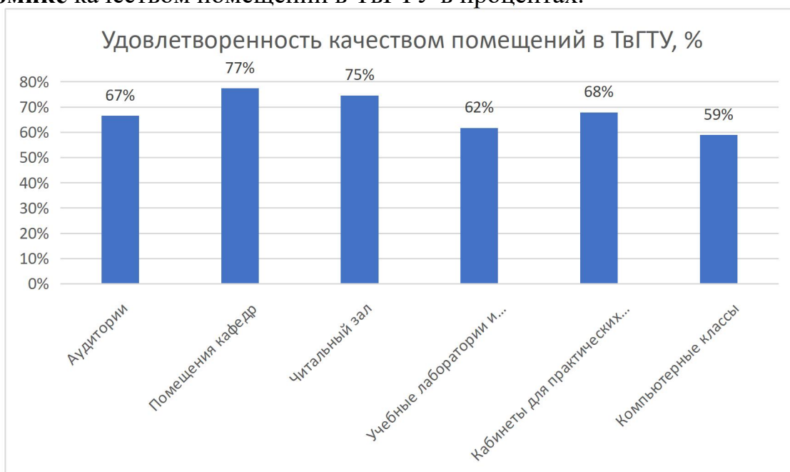
Рисунок 2 - Удовлетворенность обучающихся по образовательной программе 09.03.03 Прикладная информатика, направленность (профиль) Прикладная информатика в экономике качеством помещений в ТвГТУ

На рисунке 2 представлены данные по удовлетворенности обучающихся по образовательной программе 09.03.03 Прикладная информатика, направленность (профиль) Прикладная информатика в экономике качеством помещений в ТвГТУ в процентах.