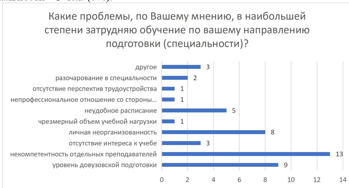
Рисунок 6 – Распределение ответов на вопрос «Какие проблемы, по Вашему мнению, в наибольшей степени затрудняют обучение по вашему направлению подготовки (специальности)?»

отсутствие перспектив трудоустройства – 2 чел. (4%); разочарование в специальности – 3 чел. (7%).