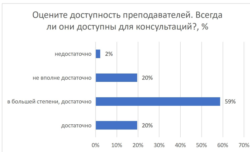
Рисунок 9 – Оцените доступность преподавателей. Всегда ли они доступны для консультаций?, %