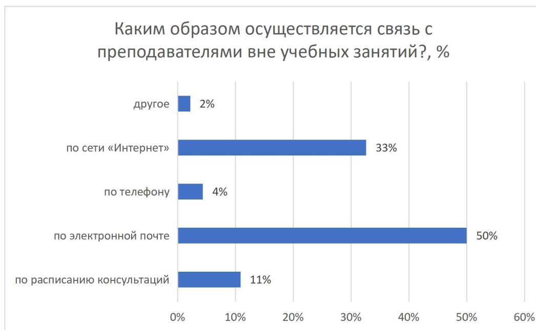
Рисунок 10 – Каким образом осуществляется связь с преподавателями вне учебных занятий?, %