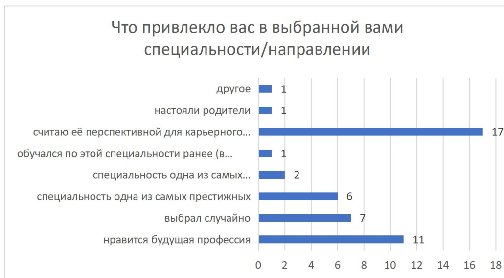
Рисунок 5 – Распределение ответов на вопрос «Что привлекло вас в выбранной вами специальности/направлении»

Респонденты на вопрос «Что привлекло вас в выбранной вами специальности/направлении» дали такие ответы (рисунок 5): нравится будущая профессия – 11 чел. (24%); выбрал случайно – 7 чел. (15%); специальность одна из самых престижных – 6 чел. (13%); специальность одна из самых высокооплачиваемых – 2 чел. (4%); обучался по этой специальности ранее (в ссузе, колледже и т.п.) – 1 чел. (2%); (2%); считаю ее перспективной для карьерного роста – 17 чел. (37%); настояли родители – 1 чел. (2%); другое – 1 чел. (2%).