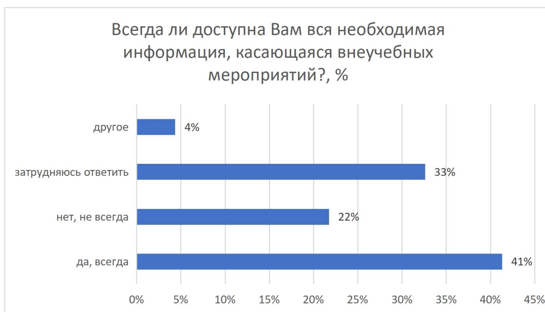
Рисунок 12 – Всегда ли доступна Вам вся необходимая информация, касающаяся внеучебных мероприятий?, %

22% (10 чел.) респондентов отметили, что хотели бы вы участвовать в деятельности по управлению качеством образования в ТвГТУ.